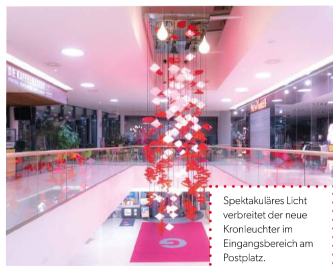
Spektakuläres Licht verbreitet der neue Kronleuchter im Eingangsbereich am Postplatz.