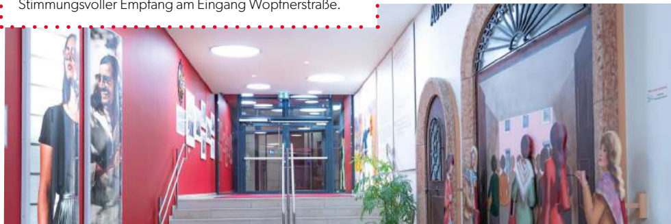
Stimmungsvoller Empfang am Eingang Wopfnerstraße.

In den letzten Wochen und Monaten wurde in den Stadtgalerien an vielen Stellen umgebaut, renoviert und es wurden neue Kunstwerke installiert. Ein tolles Zusammenspiel für noch mehr Wohlfühlatmosphäre. Wir freuen uns, dass wir unseren Besucherinnen und Besuchern somit noch mehr tolles Ambiente beim Shoppen und Genießen bieten können.