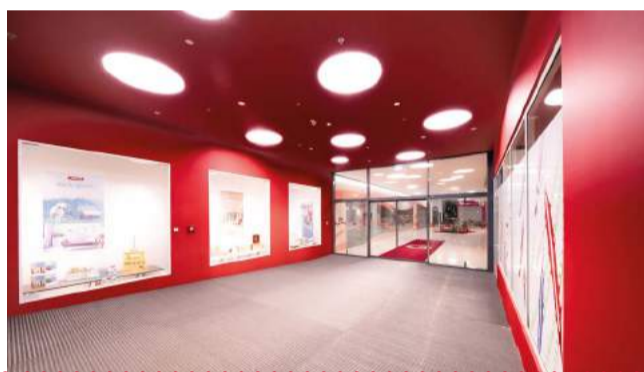
Die Wohlfühlatmosphäre beginnt schon am Eingang Barbarabrücke.

STADTGALERIEN SCHWAZ @2brands.schwaz f 2Brands Schwaz www.2brands.at